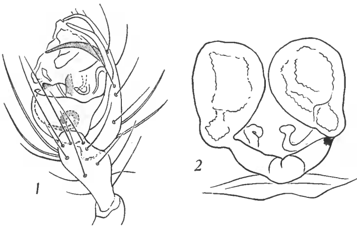
FIG. 1. — Robertus mazaurici (Sim.), ♂, bulbe, (P. M. 243). FIG. 2 : R. monticola Sim., ♀, vulva, (P. M. 249).

Décrit par E. SIMON en 1914 (4) et signalé « dans les forêts de sapins du Jura. — Jura : Forêt de la Joux ». Nous n'avons retrouvé